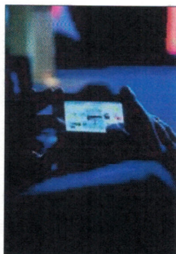
Le public a été invité à un jeu via les smartphones.