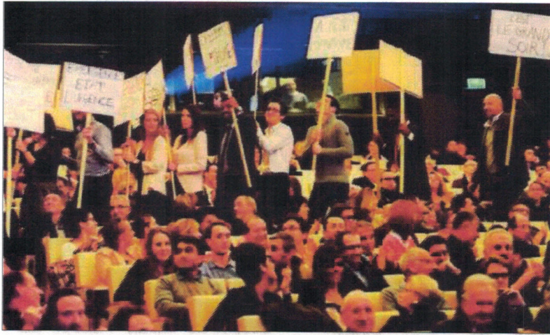
Sympas, partenaire de la soirée, a organisé une manifestation pro-optimisme pleine d'humour